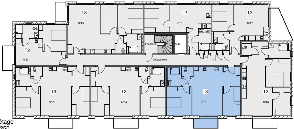
Deuxième étage échelle 1/250